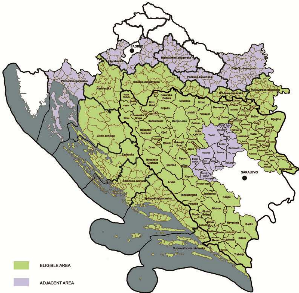
Slika 1 Karta prihvatljivih i pridruženih područja u Hrvatskoj i Bosni i Hercegovini